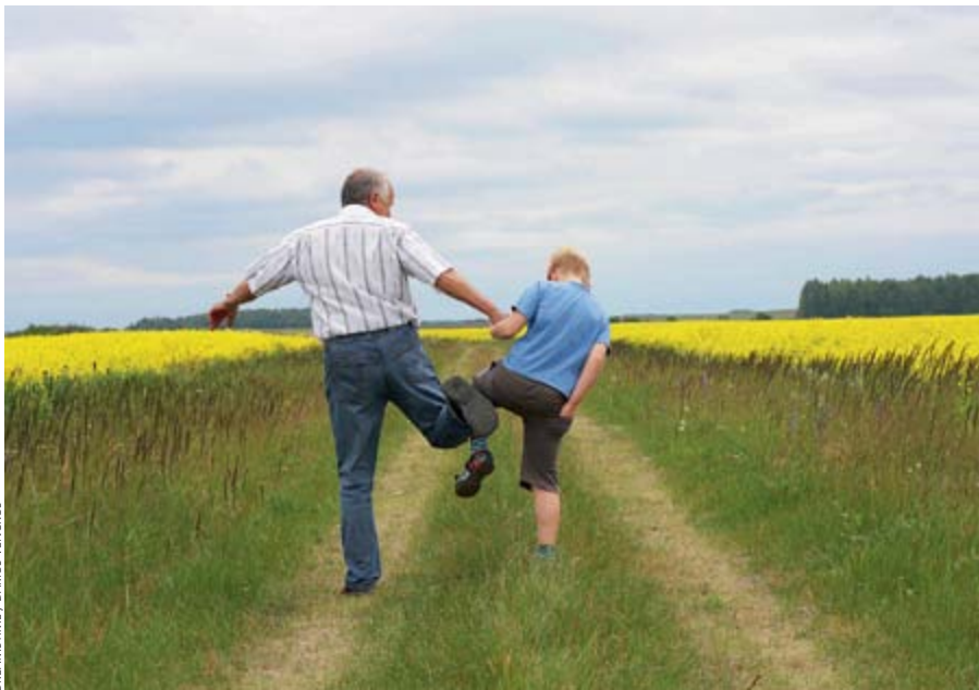
DREAMTIME / DARIUS VENCKUS